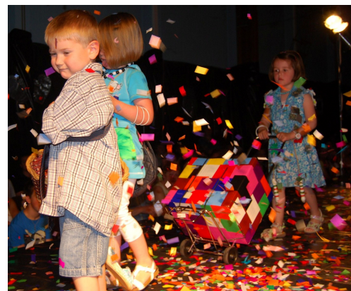
Modeshow in De Puzzel

** peiling SG: begin volgend schooljaar volgt een peiling over onze scholengemeenschap.