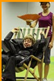
Musical De Mestkever in De Boot

Mentorwerking van het afgelopen schooljaar